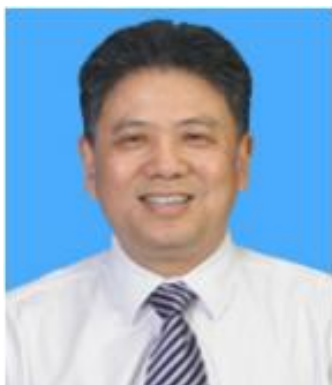
陆林 安徽师范大学教授

安徽师范大学教授、博导。全国优秀教师，全国优秀地理科技工作者，安徽省学术和技术带头人，皖江学者，安徽省高校省级教学名师。中国管理科学学会旅游管理专业委员会副主任委员，教育部旅游管理专业教学指导委员会委员，中国地理学会旅游地理专业委员会委员。 Journal of China Tourism Research 、《地理学报》《地理科学》《人文地理》《旅游学刊》编委。主持国家自然科学基金项目 7 项（其中重点项目 2 项）、国家社会科学基金项目 2 项、教育部和安徽省省部级项目 5 项，获省部级科研奖励 14 项，在学术核心期刊上发表论文 200 余篇，出版专著 6 部、教材 3 部。